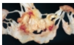
●僧帽弁に付着する疣腫(ゆうしゅ)の切除標本

このように感染性心内膜炎は、心臓病を持つている人に起こりやすい病気です。主な症状は発熱で、長く続くのが特徴です。ほかに関節痛や筋肉痛、末梢血管がつまることから指先などに痛みをともなう赤い斑